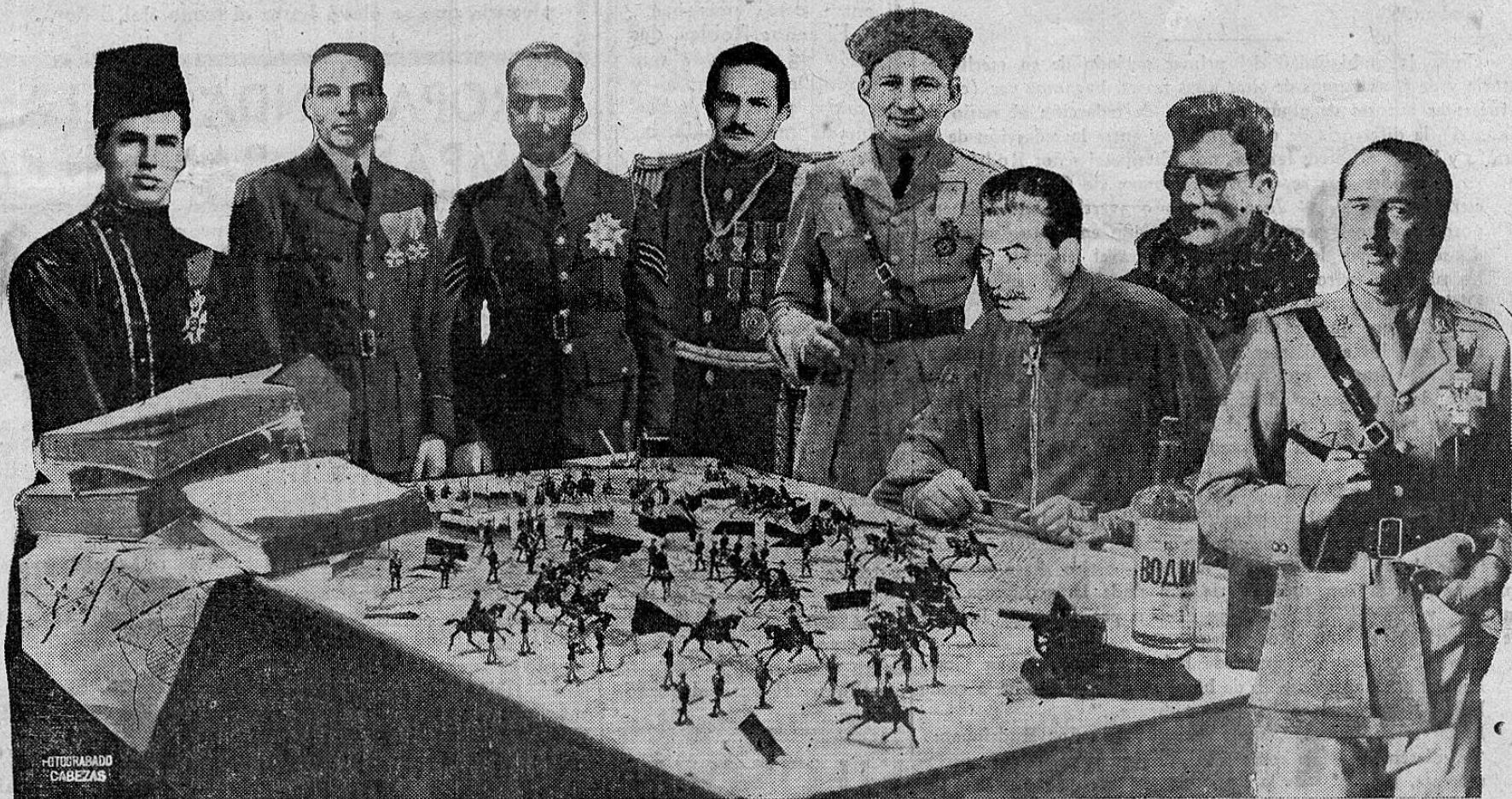
En el Kremlin del Seguro Social: Daniloff Jimenevich, Jacovich Bolañoff, Franciscovich Chaverriff, Juansoff Geneff, Fernandovich Chavich Molinoff, Chepillo Stalin, Fabián Doblesvich, y el Mariscalísimo Arturoff Echeverich.

DANILOFF JIMENEVICH TIENE VARIOS HIJOS CON LAS TARTARAS NIETAS DE IVAN EL TERRIBLE