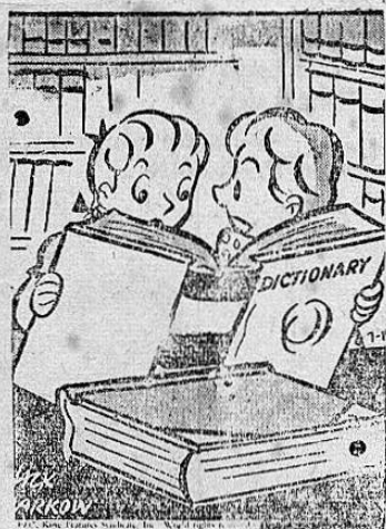
—Yo no encuentro las palabras necesarias para insultar a mi suegra