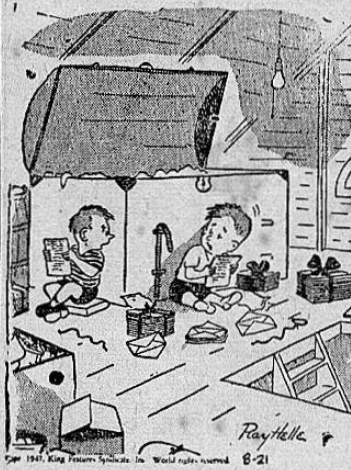
—Yo no le veo nada peligroso en estas cartas de amor de papá. Las echeré debajo de las puertas de todo el barrio

Y René, echándose para atrás cuanto pudo, exclamó: —¡Es que pienso viajar por toda la América Latina!