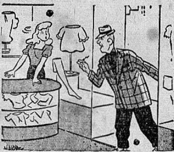
—Pronto, señorita! — Allí viene mi mujer, dígame jurele, que yo compré las naylor para ella.

Y en Costa Rica, "gobierno de Picado, equivale a pueblo desesperado. ¡Desesperadísimo!