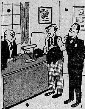
—Dice él que conoció a su papá cuando lo tenían en presidio...