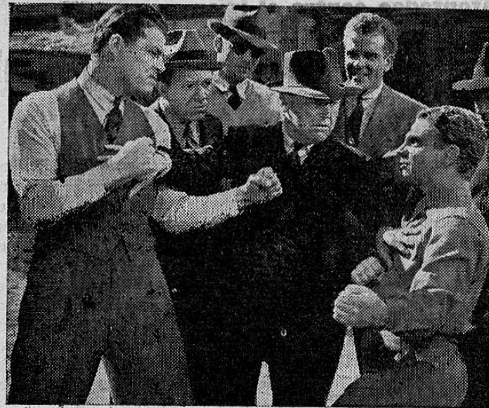
LO QUE OCURRIRA DENTRO DE POCOS DIAS

—¡Aquí no peleen, muchachós!... ¡Si quieren agarrarse, vayan a la iglesia, que allí no les pasa nada...!!!